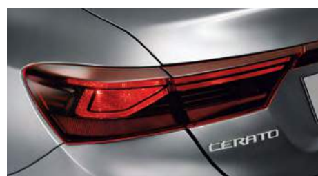
Галогенные задние фонари