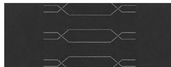
Версия GT-Line. Черная ткань