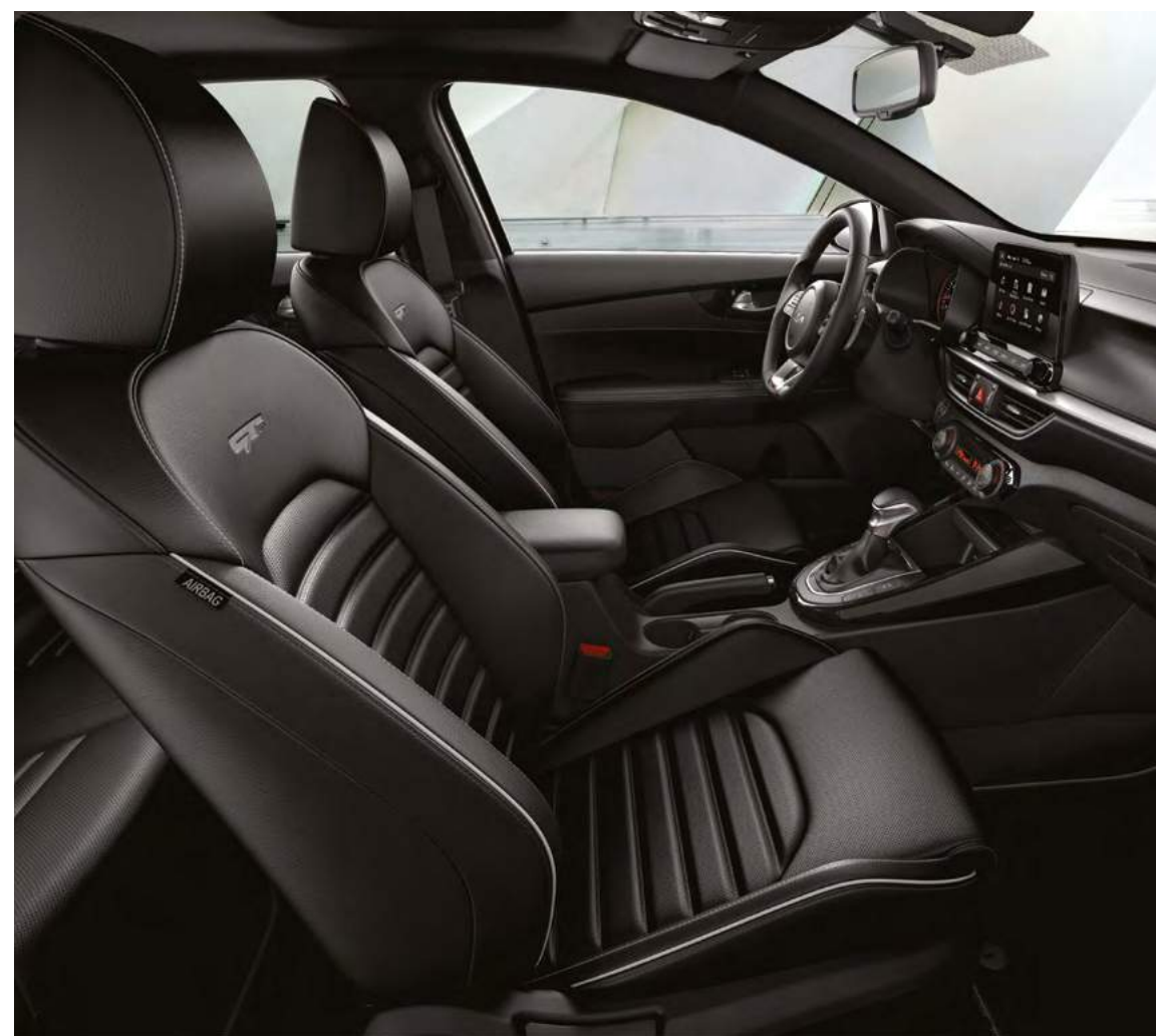
Версия GT-Line. Черная кожа