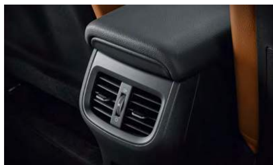
Дефлекторы климатической системы для пассажиров второго ряда