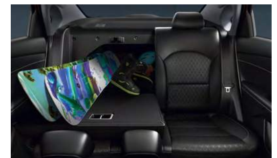
Складывающиеся сиденья в пропорции 60:40