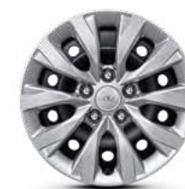
16" 205/55 R16 Стальные диски (с декоративными колпаками)