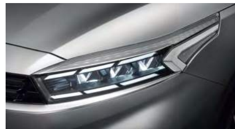
Полностью светодиодные фары