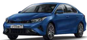
Mineral Blue (M4B)