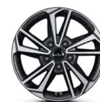
16" 205/55 R16 Литые диски Темно-серый металл