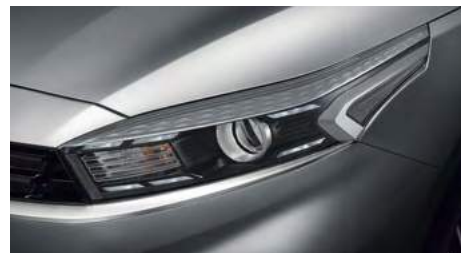
Галогенные фары со светодиодными ходовыми огнями