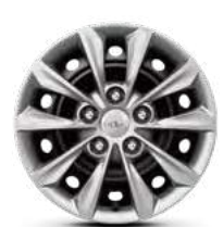
15" 195/65 R15 Стальные диски (с декоративными колпаками)