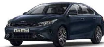
Gravity Blue (B4U)