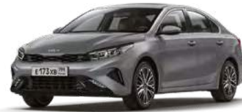
Steel Gray (KLG)