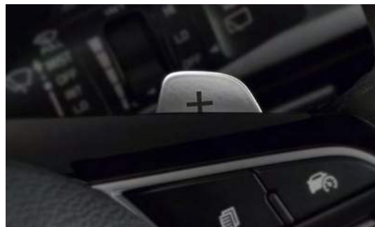
Подрулевые рычаги переключения передач