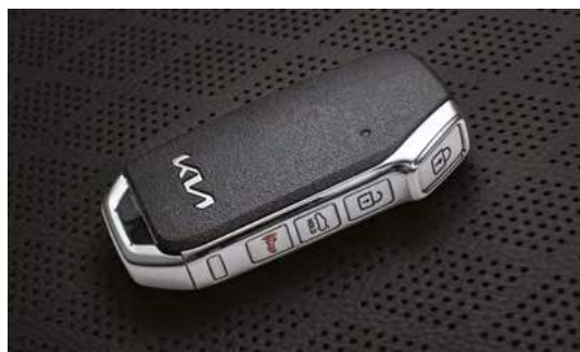
Система бесключевого доступа Smart Key и запуск двигателя кнопкой