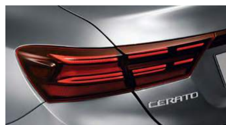
Задние светодиодные фонари