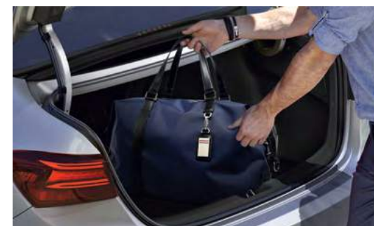
Багажное отделение вместимостью 502 л