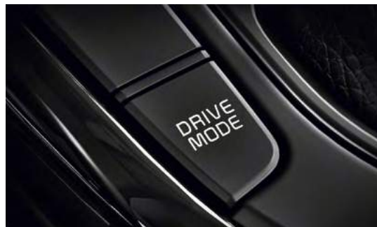
Система выбора режима движения