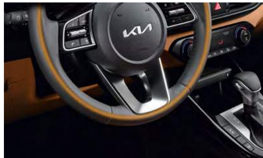
Рулевое колесо с подогревом

Что делает Kia Cerato идеальным партнером в поездках и путешествиях? Это полностью зависит от Вас. Выберите из множества опций комфорта, технологий те, которые отражают Ваше видение совершенства. И Вы убедитесь, что каждая минута, которую Вы проведете в Cerato, доставит Вам радость.