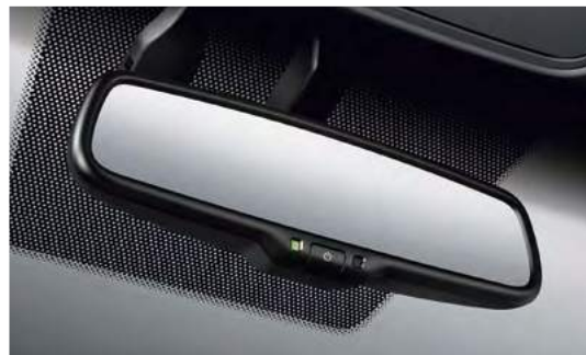
Зеркало заднего вида с автозатемнением