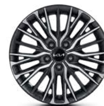
17" 225/45 R17 Литые диски Темно-серый металл