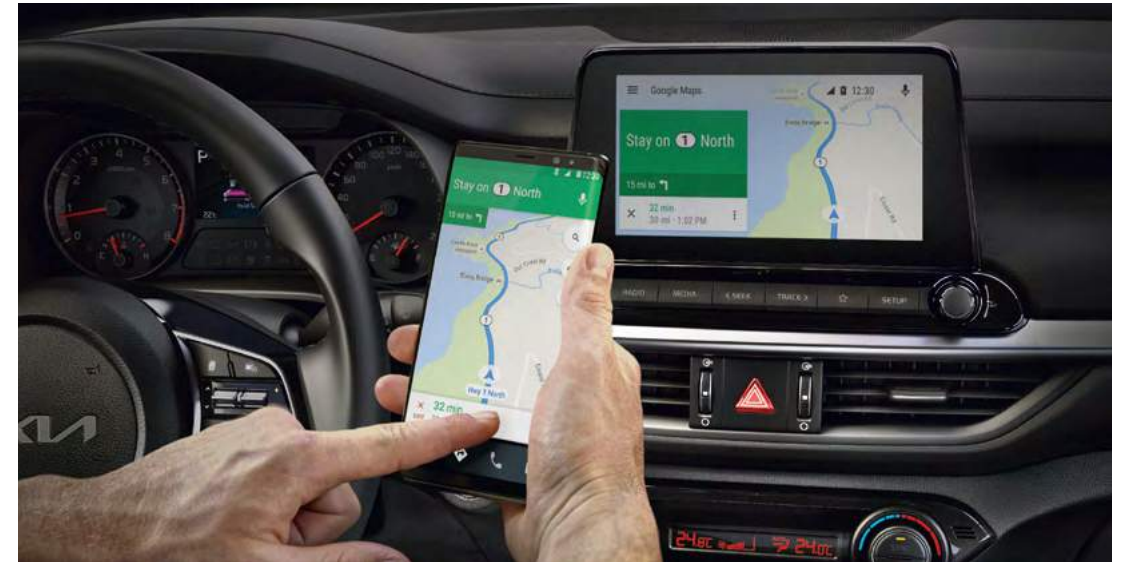
Android Auto и Apple CarPlay