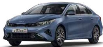
Horizon Blue (BBL)